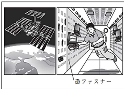
国際宇宙ステーションとその内部

一人の気づきから誕生した面ファスナーは、人びとの要求に応える形で、活躍の場を広げてきました。身近な生活場面だけでなく、宇宙空間にまで広がり、さらなる便利さが追求されています。