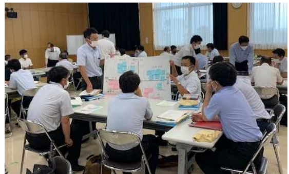
ワークショップでは、積極的な意見交換が行われました！

6月21日(火)、6月24日(金)の2日間に分けて、標記研修会を開催しました。 今回は、県警本部、中央児童相談所、宮崎県子ども・若者総合相談センター「わかば」の担当者に参加いただき、関係機関との連携について説明を受けたほか、「不登校の未然防止と解消・解決に向けた取組について」というテーマでワークショップを実施しました。