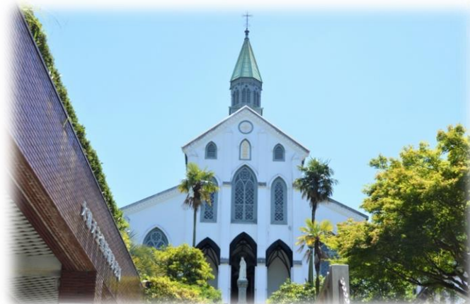
世界文化遺産の大浦天主堂