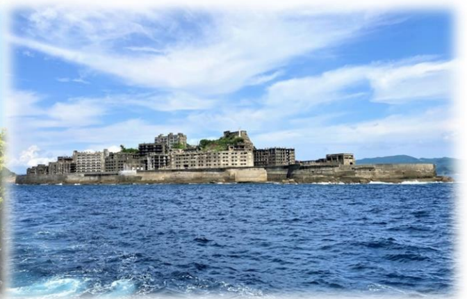
世界文化遺産の軍艦島（端島）