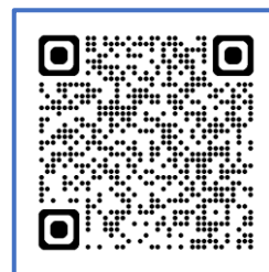
長崎大会ホームページ

ホームページ： https://sites.google.com/view/kyusyousyaken/