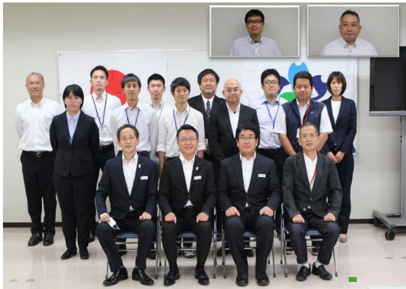
【令和4年委嘱状交付式出席者】