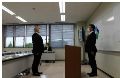
【研究所員代表あいさつ】