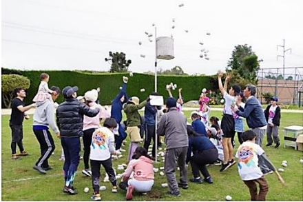
↑6月 運動会 日系企業などが集まっての行事