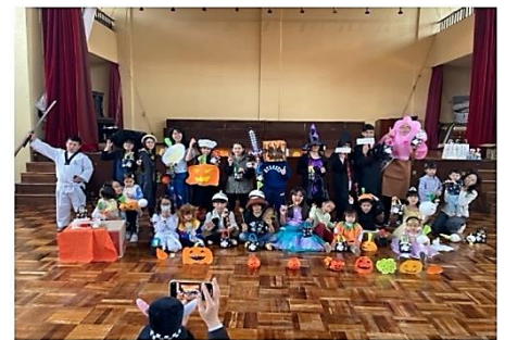
↑10月 ハロウィン集会 朝から仮装して授業や集会に参加