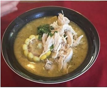
↑アヒアコ 鶏肉が安く美味しいのでおすすめ