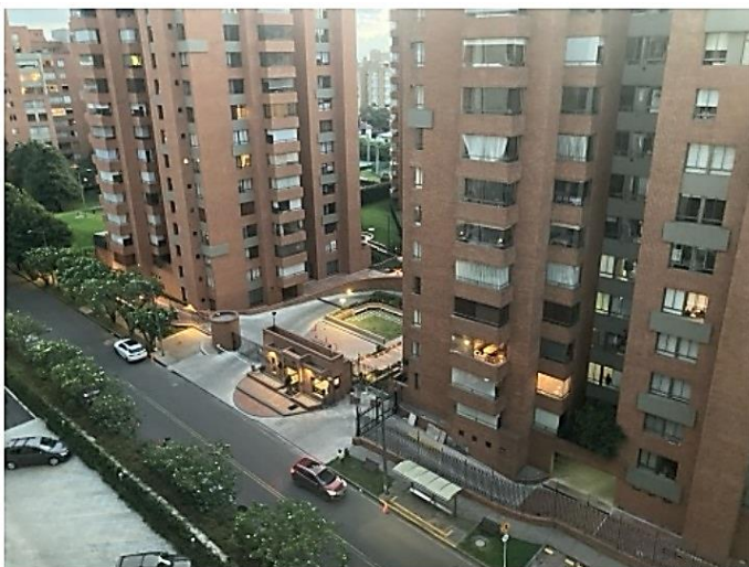
↑ エストラードという階級制度があり、地区が1(良)~6のレベルに分けられ、公共料金や物価が異なる。 写真は住居として使用したアパート