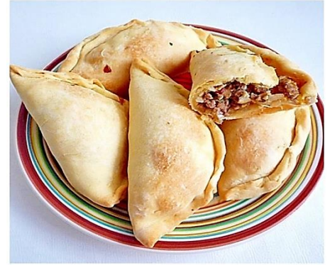
↑エンパナーダ 日本のおにぎりのような国民食