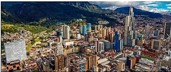
↑ 標高2,640m(世界で3番目に標高の高い首都)