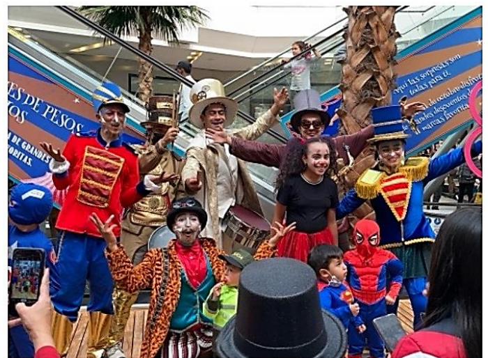
↑ キリスト教の化が強く、ハロウィンやクリスマスの行事を大事にする。