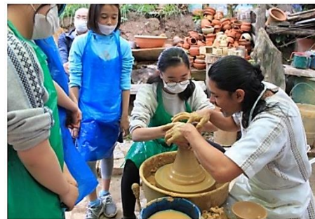
↑9月 修学旅行 年に1回の校外学習