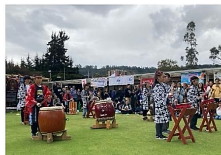
↑2月 きさらぎ祭 日系企業も参加の祭