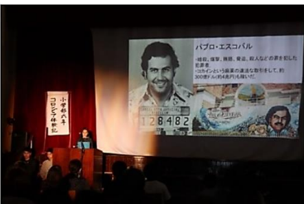
↑11月 学習発表会 コロンビアに因んだ発表会