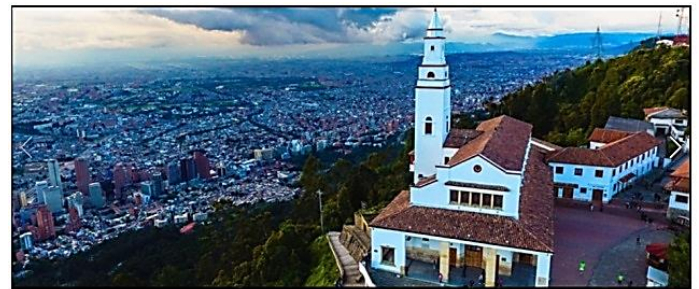
↑ 3,152m の山頂にあるモンセラテ教会