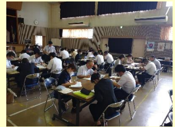
【6月24日 西諸県地区の様子】

生徒指導については、多様化、複雑化している諸課題等への対応が求められています。各学校で、生徒指導体制の見直しを図り、現在求められている生徒指導の在り方について全職員で共通理解することをお願いするとともに、課題未然防止の観点から、個々の児童生徒の「自己指導能力」を目指した「積極的な生徒指導」をお願いします。