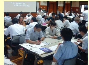
【7月1日 北諸県地区の様子】