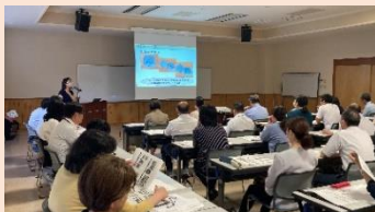
【6月17日 西諸県地区の様子】

標記研修会について、西諸県地区は6月17日（月）に高原町総合保健福祉センターほほえみ館にて、都城北諸県地区は6月21日（金）に宮崎県木材利用技術センターにて、それぞれ開催しました。