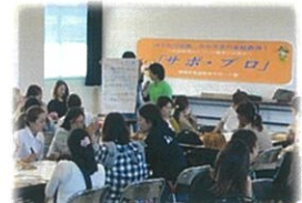
就学時健診でのサポ・プロ