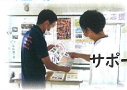
サポートチームの 周知