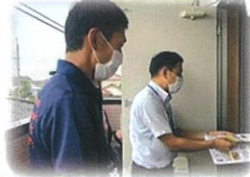
新生児をもつ 家庭への訪問