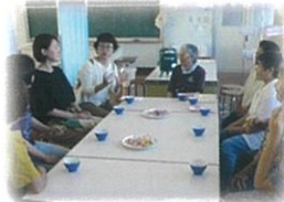
さん・さんサロン