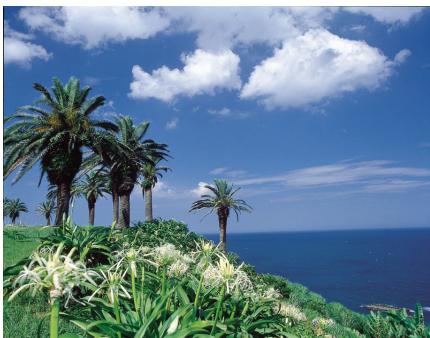
資料2 「日南海岸の写真」